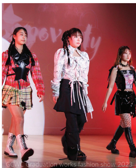
GCWC Graduation works fashion show 2023