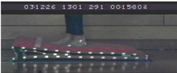
図1:ハイスピードビデオカメラで撮影された跳躍板

Frame-DIAS)によって、跳躍板の側面に10cm間隔で貼り付けた反射シールの実空間座標値を得た。スムージングによる座標値のゆがみの影響を避けるため、踏み切り局面に加え前後20コマずつもデジタル化を行なった。座標値はバターワース型のローパスフィルターによりスムージングを行ない、ノイズを除去した。遮断周波数はWinter(1990)の方法を用いて計測点毎に決定した(16~34Hz)。